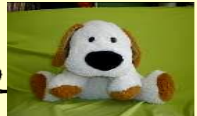
ぼくのなまえは、よむよむだよ！

1ねんせいの みなさんは、としよしのつかいかたを おぼえてからの かしだしとなりますので、もうすこし まっていて くださいにゃ！