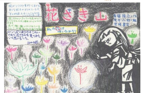
望友さん・真由さん・お母さんの作品

また、受賞はならなかったものの、提出していただいた作品は、どれも温かさが伝わるすてきな作品ばかりでした。ご協力ありがとうございました。ぜひ、来年度もよろしく願います！！