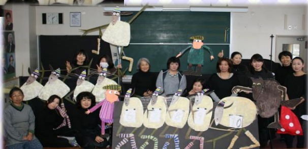
おはなしやさん ありがとうございます♪