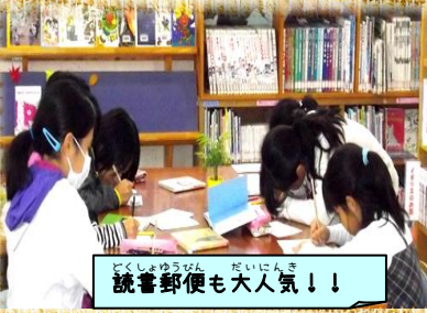
どくしよしゅうかん だいにんき 読書郵便も大人気!!