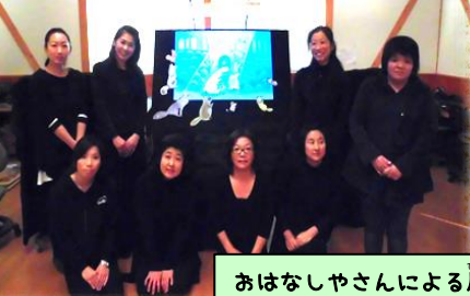
おはなしやさんによる屋のおはなし会