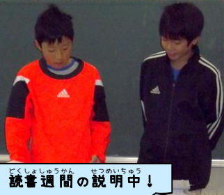
どくしよしゅうかん せつめいのちゅう 読書週間の説明中!