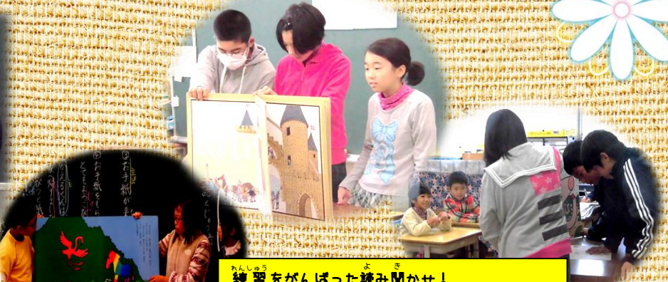
れんしゅうをがんばった読み聞かせ! 1・2年生によるこんでもらえてよかったね♪