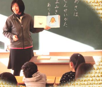
わくわく出張 読み聞かせ♪