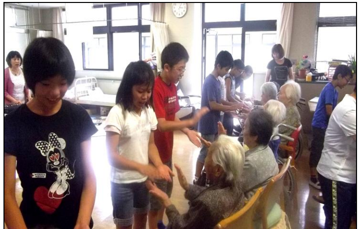
会場では、素敵な笑顔があふれていました♡

お年寄りの方も毎年この日を楽しみにしてください。とても喜んでもらうことが出来ました。図書委員のメンバーも素敵な思い出が作れたようです。