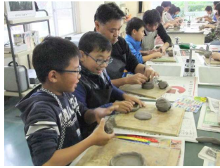
いい形になってきた！