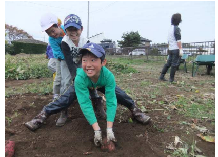
うんとこしょ。どっこいしょ！

後、目指すさつまいもの周りを犬のように掘り、みんなで力を合わせてひっこ抜きました。今年は、ちょっと小ぶりのさつまいもようです。