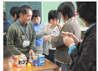
竹とんぼはバランスが大事だよ

本当に素晴らしい取り組みですね。講師の先生方、運営に携わったPTA役員の皆様、本当にありがとうございました。