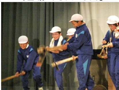
4年生「おいしい大豆作り隊」