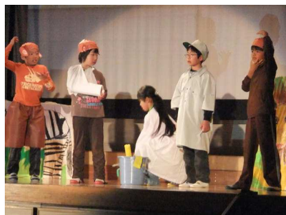
2年生「動物園に行こう」