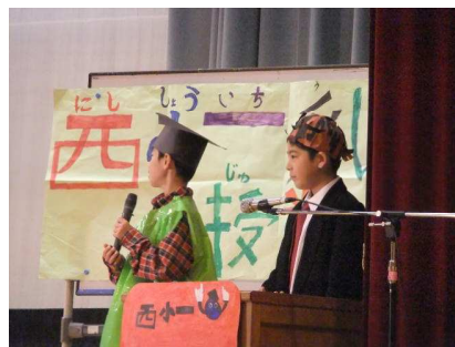
3年生「西小いち受けたい授業」