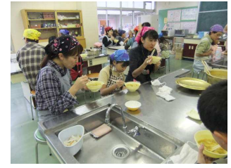
手作りほうとう おいしいね！