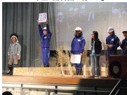
5年生「できたよ、うまい米」