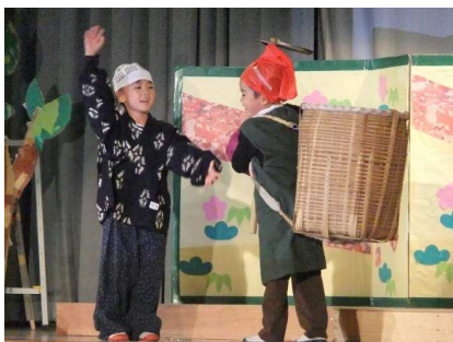
1年生「劇 おむすびころりん」