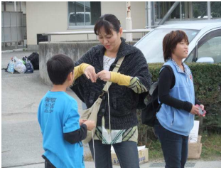
巻き方が大事なんだよ！