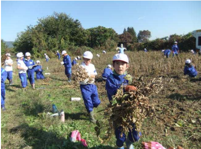
4年生はよく働きます。畑には1粒の大豆も落ちていませんでした。

4年生が、5月に種蒔きした大豆を収穫しました。軽トラック2台分にもなり、大収穫です。今は、プールにピラ