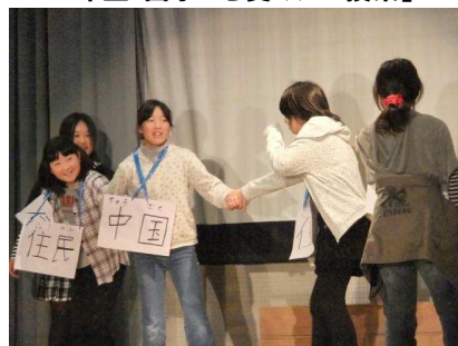
6年生「平和の世界を目指して」

たくさんのご感想ありがとうございました！諸課題には、よいよい改善を図り、さらに充実した「むらやま祭」を目指します！