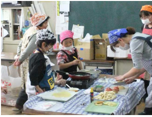
うすく上手に焼けているね！ まずはバームクーヘンの下地から ペン立ての板の形を工夫しようね！ かわいいでしょう！