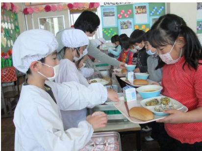
盛り付けも上手にできました！

この日のメニューは、くろパン、かぼちゃほうとう、ちくわのいそべあげ、ごぼうサラダ、ゼリー、牛乳でした。みんな残さず完食でした。静かに落ち着いて食べていたのでとても感心しました。