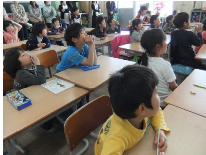
2年生「ふきのとう」(国語)