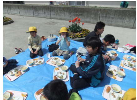
6年生と1年生がチューリップの花の前でお花見給食をしました。