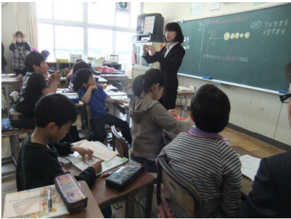
4年生「角の大きさ」(算数)