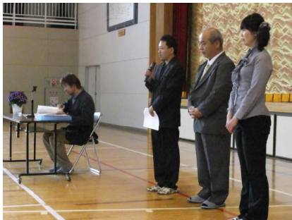
正副会長様ありがとうございました。(19日 PTA総会での退任挨拶)