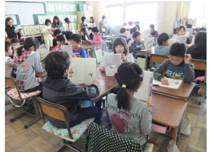
3年生「音読しよう」(国語)