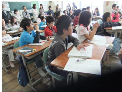
5年生「漢字の成り立ち」(国語)