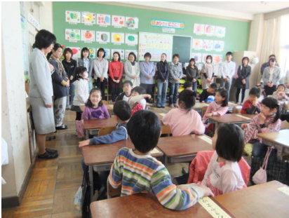
1年生「どうぞよろしく」(国語)