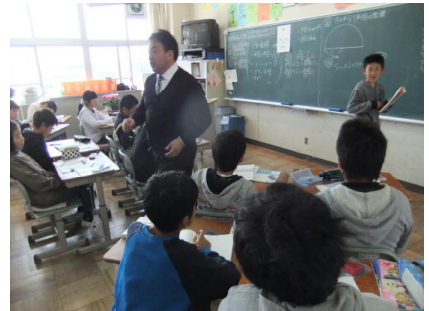
6年生「円の面積を賢く使おう」(算数)