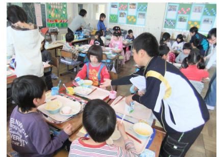
6年生が牛乳パックのたたみ方を伝授！