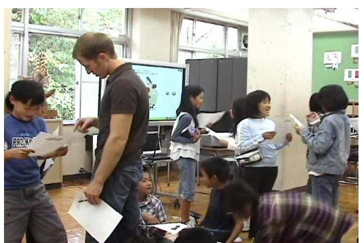
自由なコミュニケーション活動