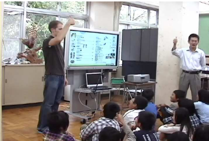
授業の導入 ALT の自己紹介