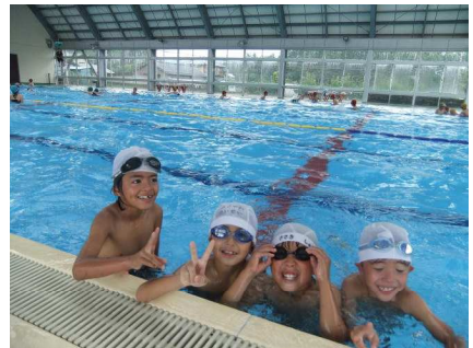
夏休み最後のプール！たくさん泳いだよ！

今年も、猛暑日や真夏日の暑い日が続く、県内小中学校唯一の床が上下するプールは大盛況でした。実施日は15日間でしたが、のはべ1051人が利用し、1日平均約70人、多い日は100人を越えました。学年では、2年生と3年生が共にのはべ237人で最も多かったです。県内には、上屋付屋外のプールはたくさんありますが、床が学年に応じて上下するプールはありません。天候や紫外線の心配もなく利用できることはとてもありがたいことです。ともあれ、このように大盛況の中、無事安全に終了できましたのも、プール当番の保護者の方々や各家庭の健康管理へのご配慮のお陰と深く感謝いたします。ありがとうございました。