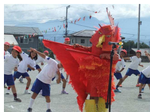
ファイヤーフェニックス(赤組)