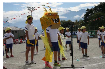
ビクトリエロー(黄組)