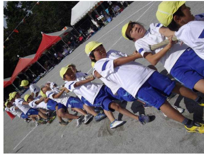
上を向いていい姿勢ですね。