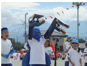
ブルードラゴン(青組)