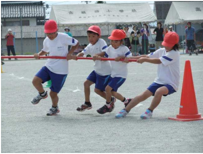
理想的な回り方です！