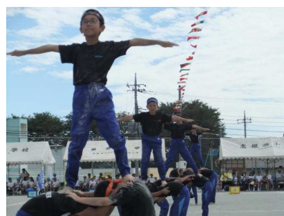
仲間と創る高西オリンピック！