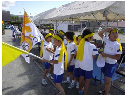
さあ～応援を始めるぞ！