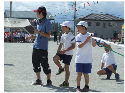
さすが本部役員！立派な開・閉会式でした！放送係は運動会の雰囲気盛り上げました！ 審判係の目は真剣です！