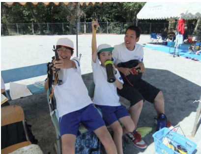
ちょっとリラックスタイムの出発合図係