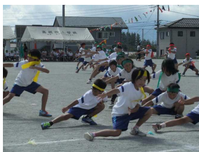
むらやまソーラン2012！