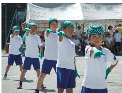
ずっとずっとトモダチ！