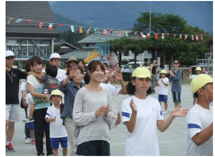
最後は恒例の高根音頭です。