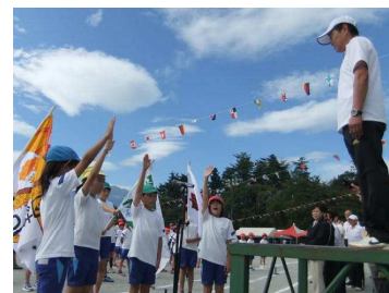
各リーダーの力強い誓いの言葉！

さて、これからもむらやま祭や自然教室などの行事、また、各学年では教科や総合学習での校外学習が次々と続いていきます。いつもお願いしていますが、それぞれの行事は、階段を一歩一歩上るように子どもたちにとってのステップアップの大きなチャンスとなります。個々の子どもたちにとって、各行事や学習に居場所や役割があり、自分ではなくてはならない存在なんだと心と体で感じられる学びにしていきたいと思えます。今後ともご支援とご協力をよろしくお願い致します。